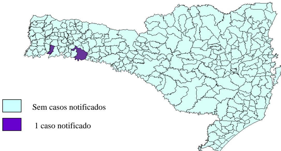
Figura 3 - Distribuição de casos de hanseníase em menores de 15 anos, por município de residência. Santa Catarina, 2009.

A redução de casos em menores de 15 anos é prioridade do Programa Nacional de Controle da Hanseníase (PNCH), tendo em vista que a detecção de casos em crianças tem relação com doença recente e focos de transmissão ativos no âmbito familiar e social próximo. Em 2009, foram notificados dois casos novos de hanseníase nessa faixa etária, apresentando uma taxa de detecção de 0,14%.